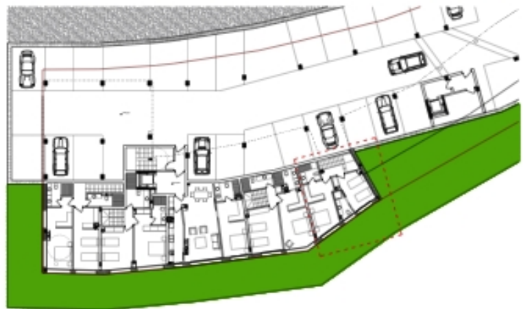
VIVIENDA B1-PA/5 PLANTA PRIMERA DEL DÚPLEX ESCALA 1/100