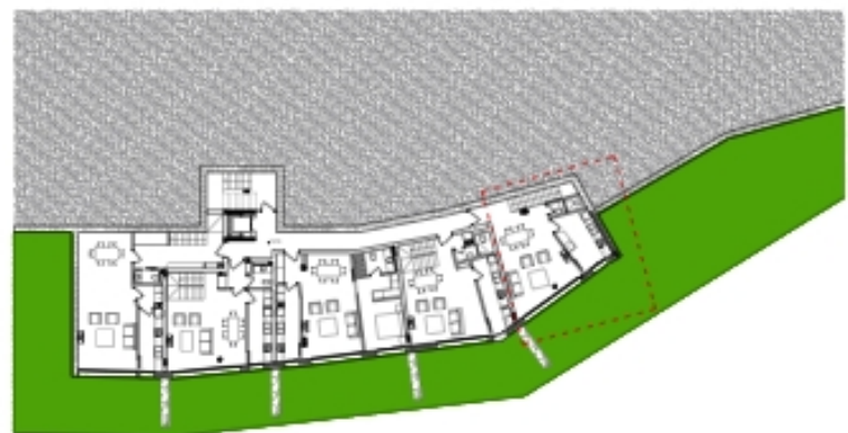
VIVIENDA B1-PA/5 PLANTA BAJA DEL DÚPLEX ESCALA 1/100