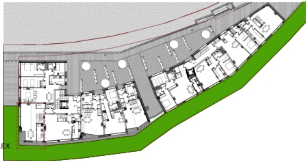
VIVIENDA B1-PC/5 PLANTA BAJA DEL DÚPLEX ESCALA 1/100