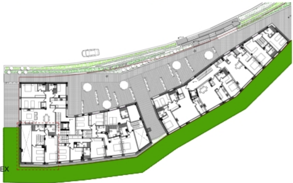
VIVIENDA B1-PC/5 PLANTA PRIMERA DEL DÚPLEX ESCALA 1/100