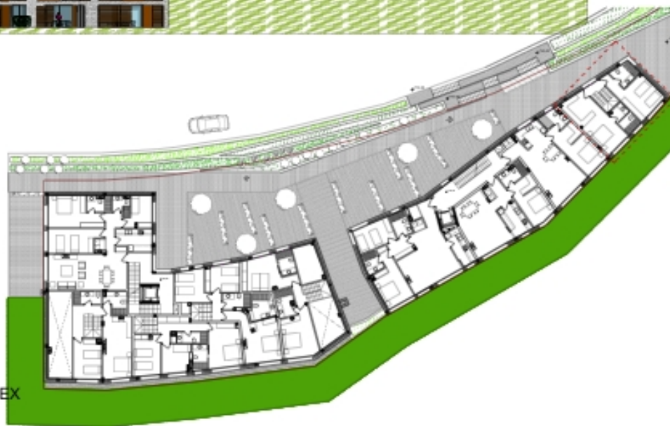
VIVIENDA B2-PC/4 PLANTA PRIMERA DEL DÚPLEX ESCALA 1/100