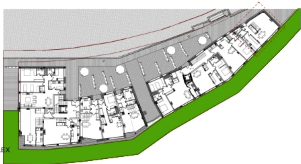
VIVIENDA B2-PC/4 PLANTA BAJA DEL DÚPLEX ESCALA 1/100